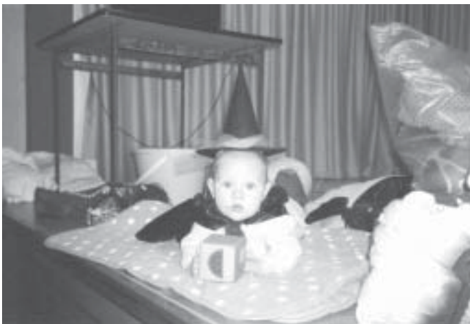
Helau - Faschingsnarren aus Steinsdorf