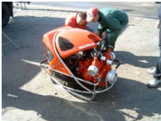
Erste Begutachtung durch die Kameraden