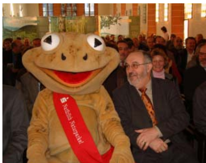
Max Moorfrosch, das Maskottchen