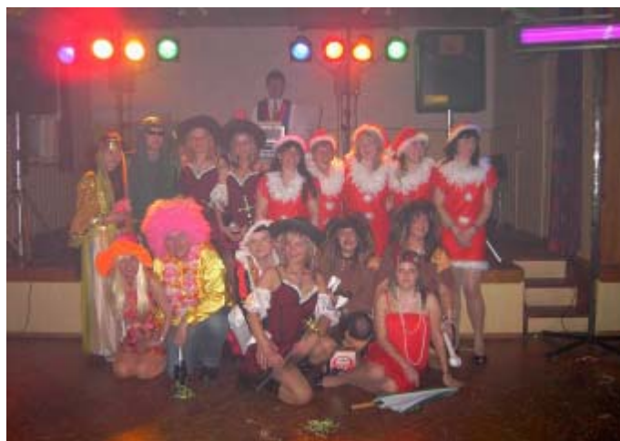
Die schönsten Kostüme